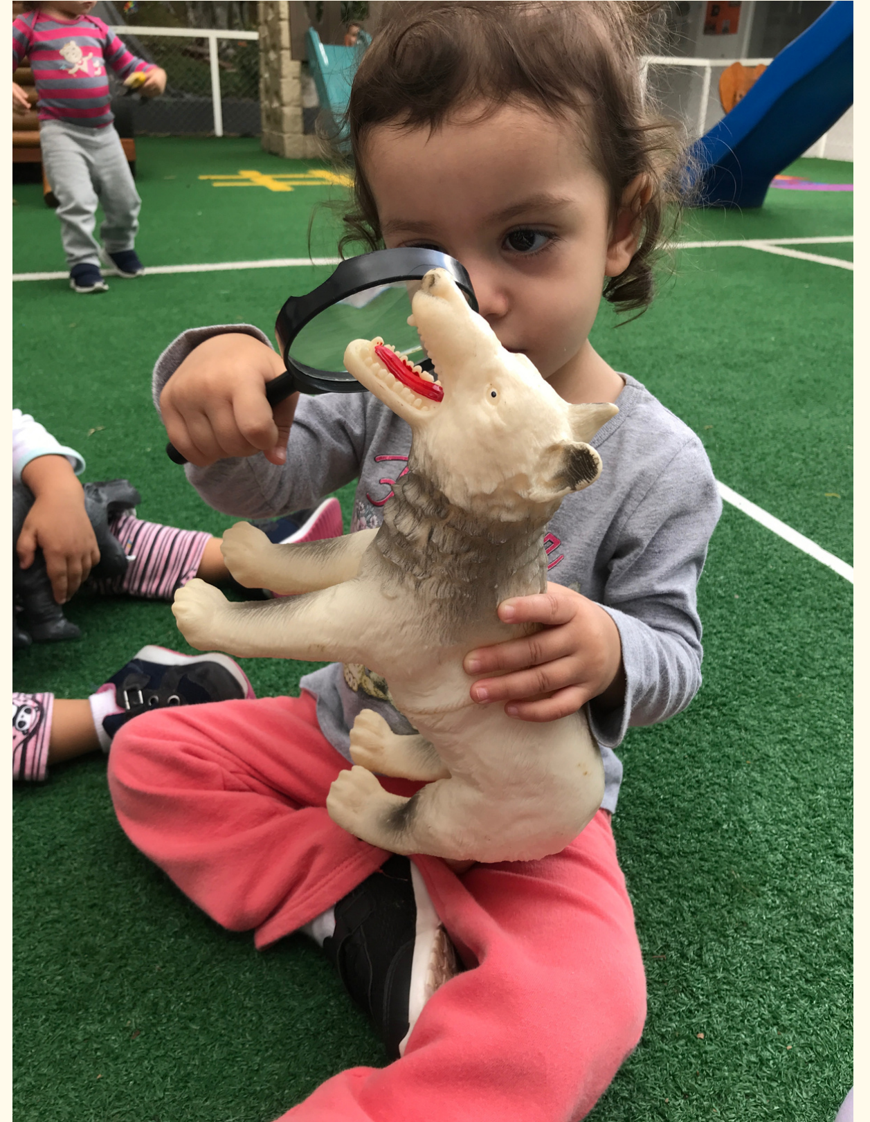
C.S se impressionou com o tamanho da boca do lobo