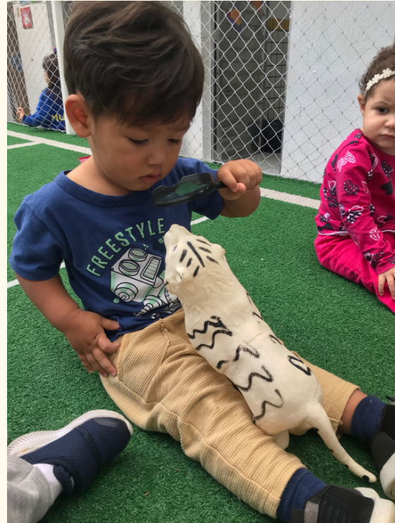
R.S olhou dentro da boca de todos os animais