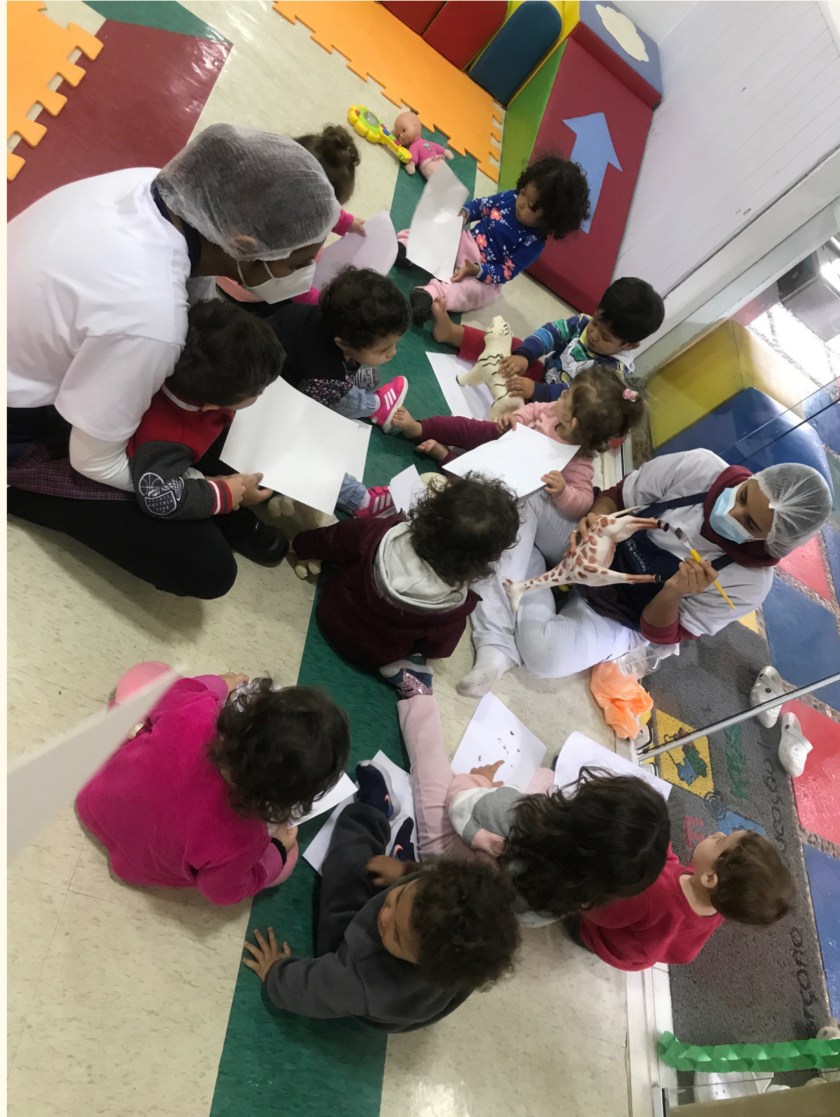
R.S adorou carimbar as patas dos animais