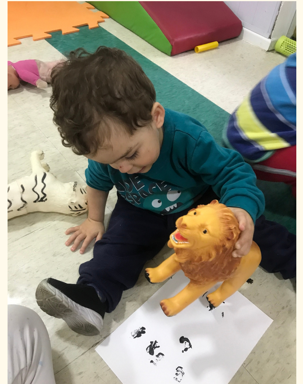
G.G fez diversos movimentos para carimbar