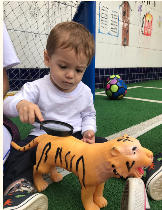
M.M ficou passando a lupa em cima das listras do tigre e vendo “aumentar”